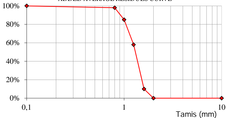
COURBE DES REFUS MOYENS CUMULES ADDED AVERAGE RESIDUES CURVE