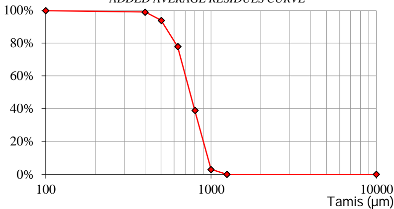
COURBE DES REFUS MOYENS CUMULES ADDED AVERAGE RESIDUES CURVE